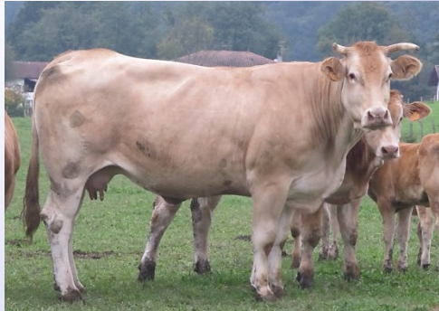
Uranie sa mère