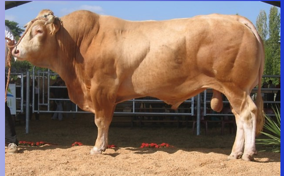
Théodule son père